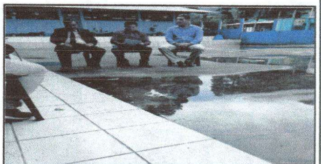
FOTO6: Visita de autoridades a la escuela un día que cayó una pequeña llovizna, para verificar los daños que causa la lluvia a la escuela.

Observación: Si es necesario se pueden agregar hojas a más y actualizar el número de hojas.