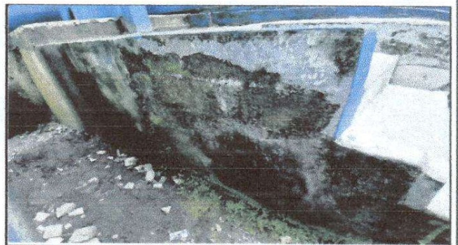
FOTO4: Daños causados por el agua a las gradas que nos llevan a 4 aulas de abajo y al aula del segundo nivel.