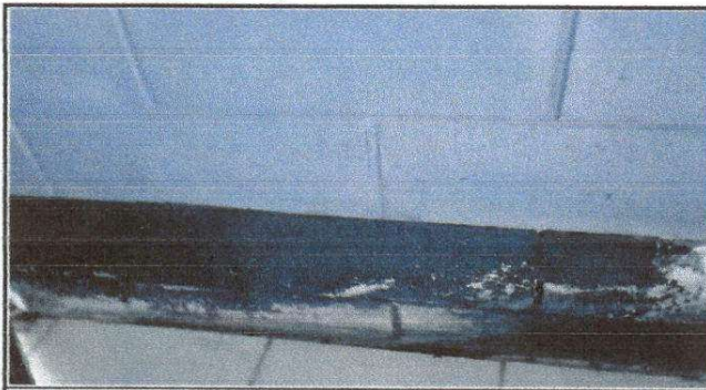
FOTO3: Marcas que deja el agua cuando ingresa a la dirección del establecimiento educativo.