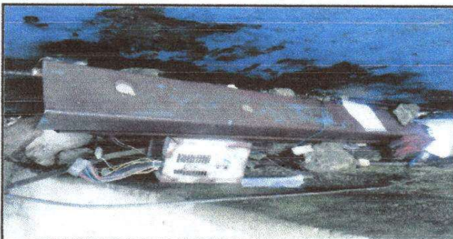
FOTO5: Costaneras que un día sirvieron en el techado del patio.