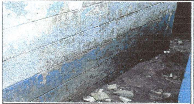
FOTO2: Daños a la pared de un aula por el agua y que precisamente sobre ésta aula hay un aula en segundo nivel, que corre riesgo si el primer nivel colapsara.